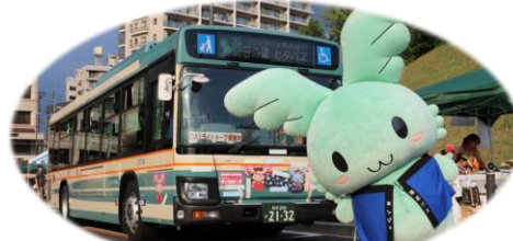
※写真は昨年イベント開催の様子です。

※1953年から使われている西武の路線バスカラーは「未来に向けての軽快さと流動感」を表すピーコックブルーの「笹の葉」をイメージしています。