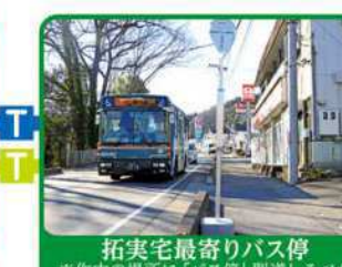
拓実宅最寄りバス停