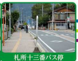
札所十三番バス停