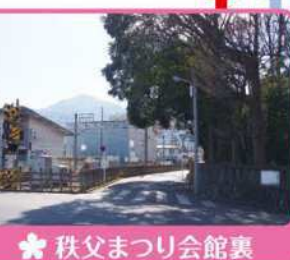
秩父まつり会館裏