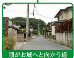
順がお城へと向かう道