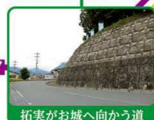
拓実がお城へ向かう道