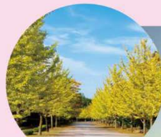
ミュージックパーク イチョウ並木 (見頃: 10月下旬~11月上旬)