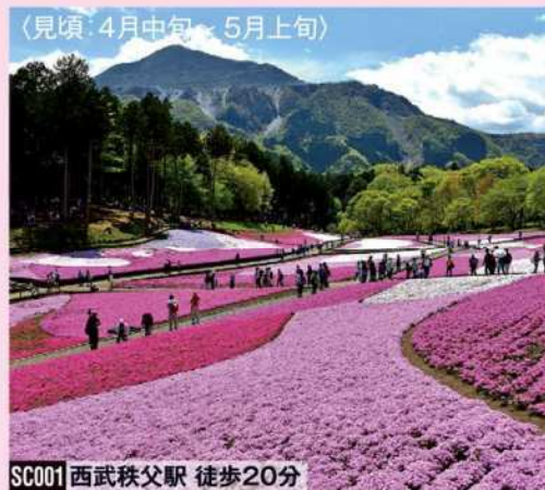
SC001 西武秩父駅 徒歩20分