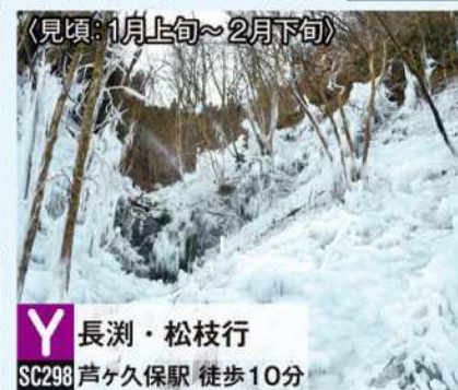
(見頃: 1月上旬~2月下旬)