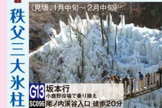
(見頃: 1月中旬~2月中旬)