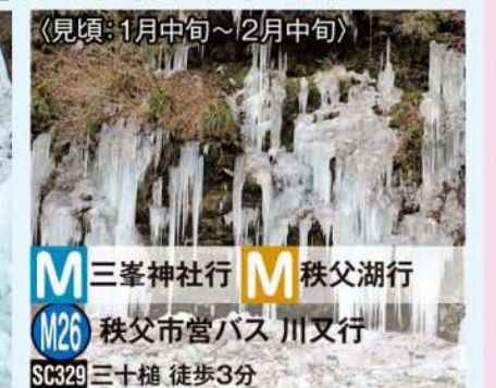
(見頃: 1月中旬~2月中旬)

M 三峯神社行 M 秩父湖行 M26 秩父市営バス 川又行 SC329 三十槌 徒歩3分