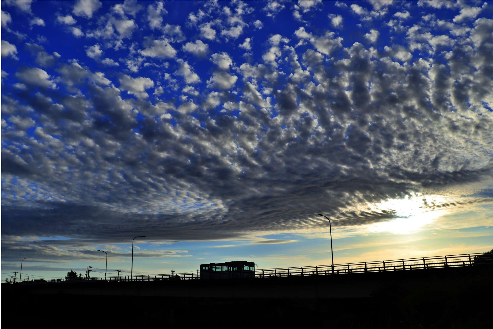
帰り道を走るバス 応募者「スタジオエブリィ」 撮影地「新潟県新潟市」