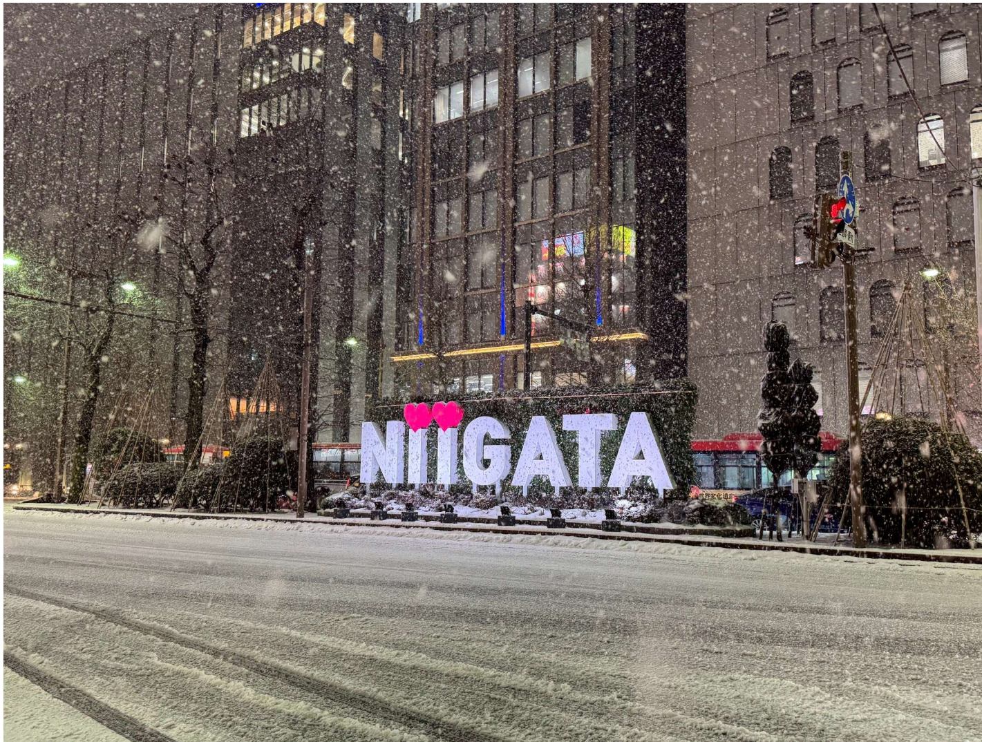
雪の新潟駅前 応募者「わっほー」 撮影地「新潟県新潟市」