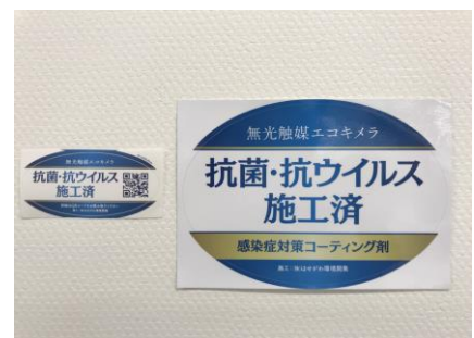
(施工済みステッカー)