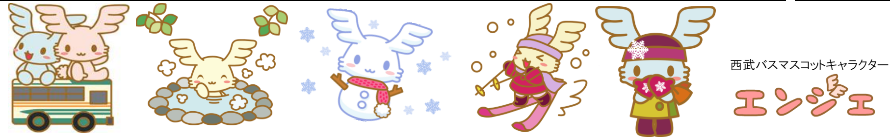
西武バスマスコットキャラクター