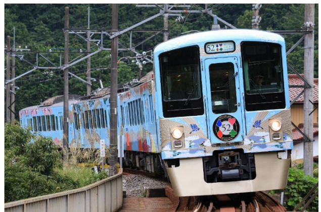
西武 旅するレストラン「52席の至福」