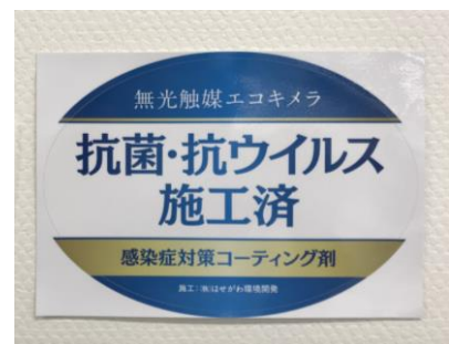
(施工済みステッカー)