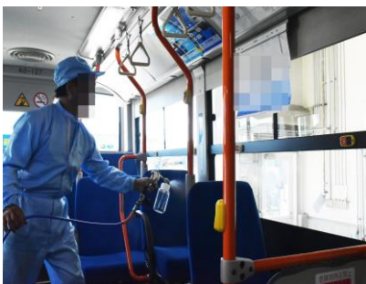
(コーティング施工イメージ)