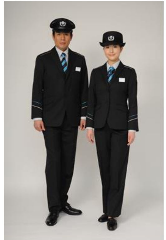
新たに着用開始する新制服（イメージ）