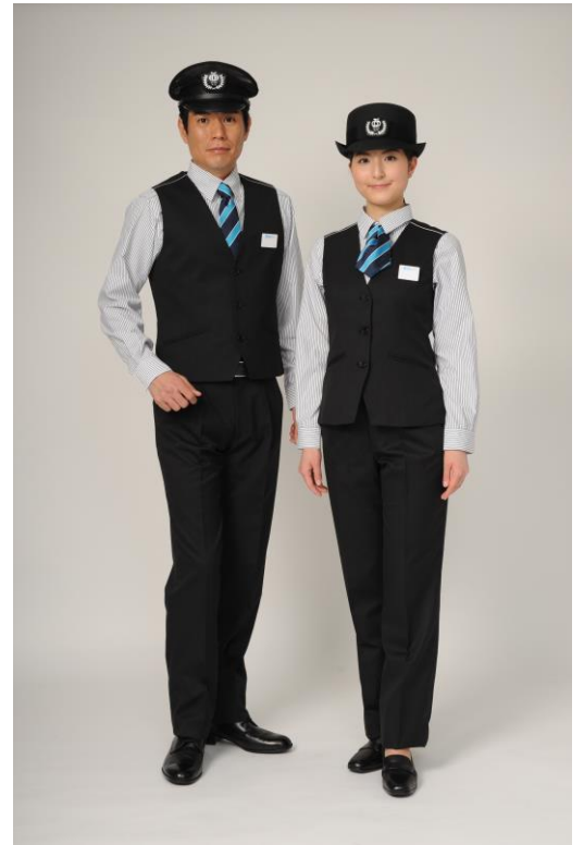
新制服イメージ（冬・ベスト着用時）